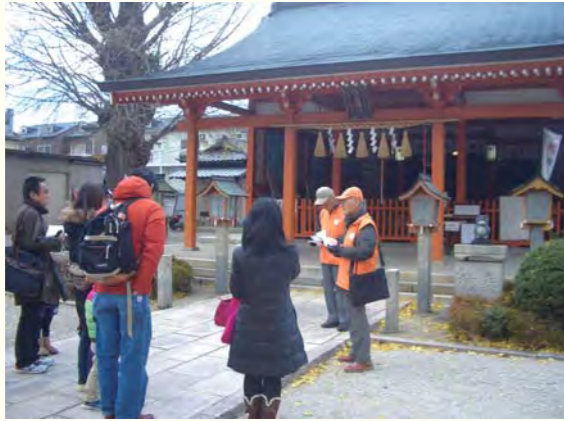
▲教科書にも載っていない情報をゲットできます!