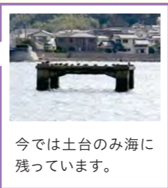
今では土台のみ海に残っています。