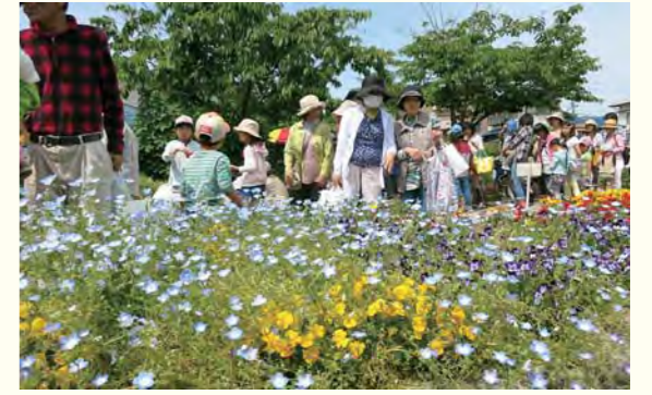
▲公園にはたくさんの花が咲いています。