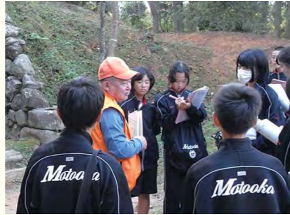
▲小中学生を対象にした案内も実施しています。参加者募集中。