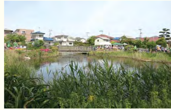
▲整備された中牟田池は、ひょうたんの形がしっかりみえます。