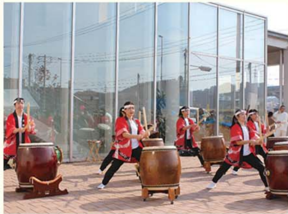
▲さいとびあで開催された「第1回いとにぎわい祭り」の様子。