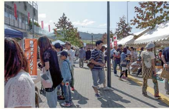
▲屋外のテントでは、地元自慢の食のブースを展開します。