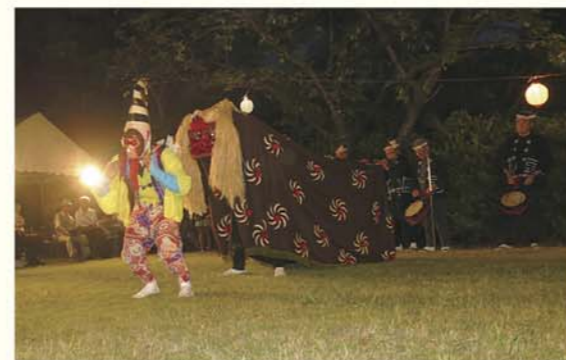
▲周船寺の丸隈山古墳観世音大祭での宇田川原豊年獅子舞。

そんな地域の宝や魅力を地元の皆さん自身が応援し、盛り上げる企画が、西部六校区のみんなで取り組む「西部六校区まつり」です。今回は、伝統の「今津人形芝居」や「獅子舞」の公演のほか、同時開催企画として、地元の伝統食「そうめんちり」や「かしわご飯」の販売。元岡で発掘され話題を集めた「庚寅銘大刀」の実物展示。「手作り雑貨市」や「農産物の販売」なども予定されています。「西部六校区」の素晴らしい実感を催します。