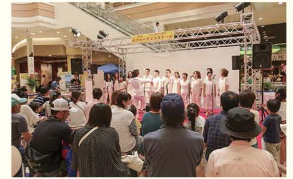
▲イオンモール福岡伊都の特設ステージでも日頃の成果を披露。