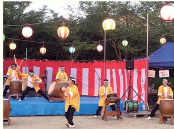
▲様々な地域のイベントに積極的に参加しています。