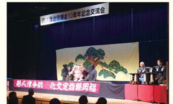
▲今津人形芝居は、様々な催しでも披露されています。

【日時】2015年10月18日(日) 10:00～16:00 【会場】さいとびあ